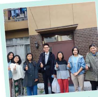
就職後フォローアップ